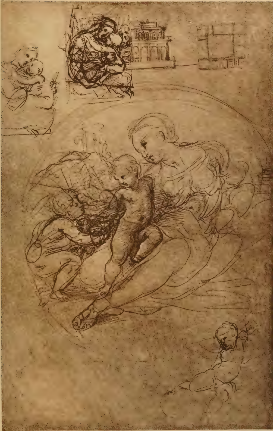
Diverses études (Vierge di Casa d'Albe, Madonna della Sedia, etc.)